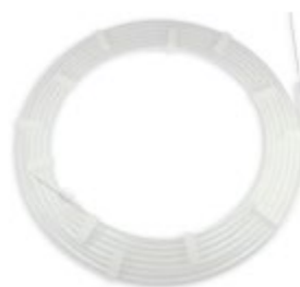
Distributeur de fil-guide

Le fil peut être facilement éjecté et rétracté à l'aide de ce distributeur innovant. Grâce à son design compact, le distributeur est maniable et facile à utiliser. Il permet également un rinçage simple et rapide du fil.